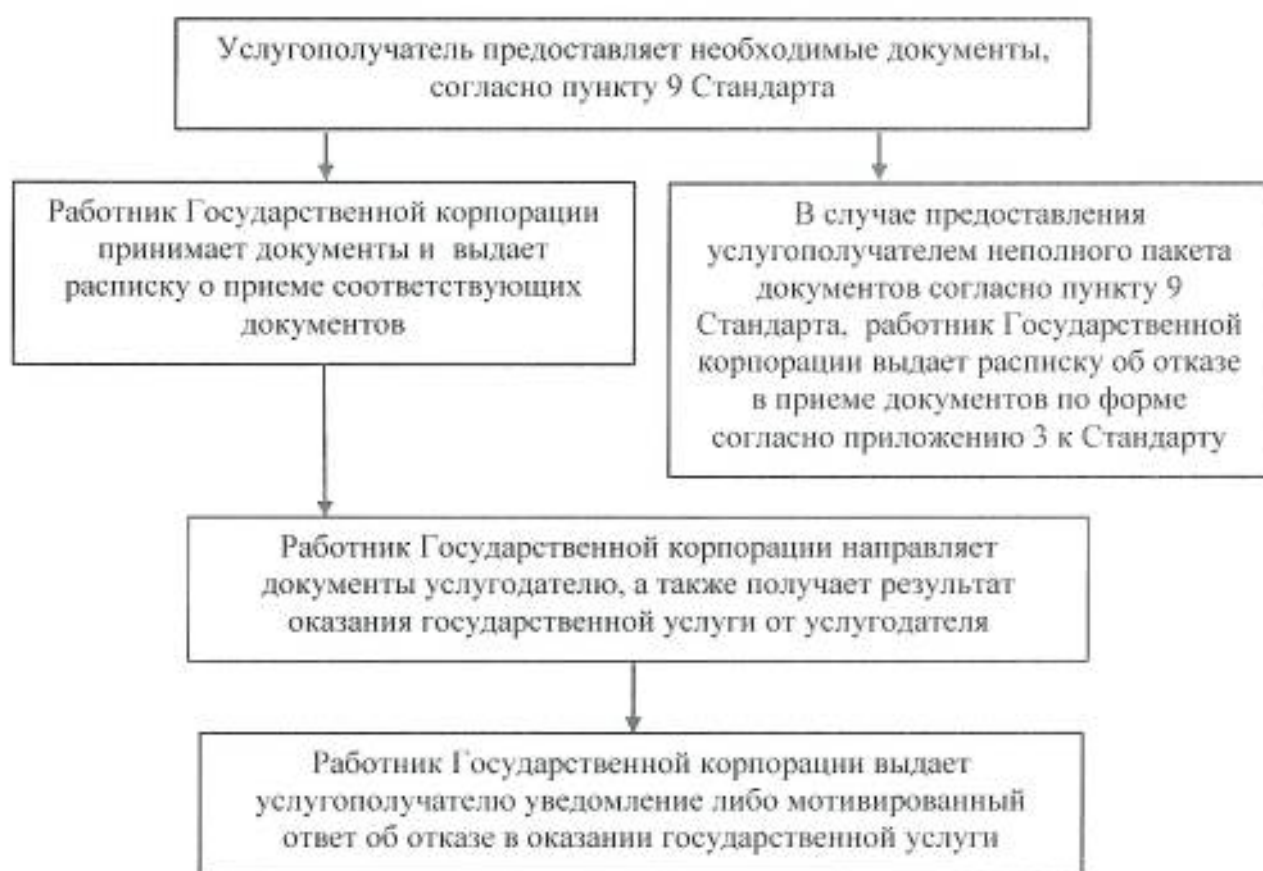
Схема получения государственной услуги при обращении в Государственную корпорацию

Приложение 2 к регламенту государственной услуги «Постановка на учет и очередность, а также принятие местными исполнительными органами решения о предоставлении жилища гражданам, нуждающимся в жилище из государственного жилищного фонда или жилище, арендованном местным исполнительным органом в частном жилищном фонде»